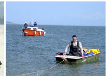
un peu méfiant lors de l'amérissage