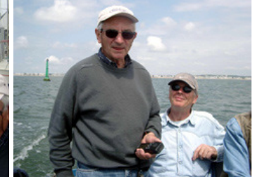
GPS en main le capitaine fait le cap