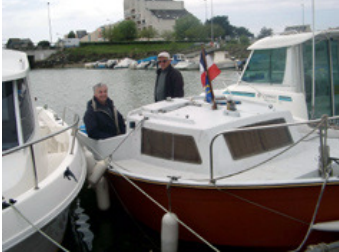
encore au ponton

Dès samedi 13 heures sur un ponton du Pouliguen 8 membres du club, la mine réjouie, sont prêts à embarquer direction l'île des Evens ; superbe petite île en face de la baie de La Baule. Une partie de pêche de 24 heures est annoncée et très attendue.