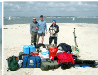
Une partie du matos pour 4