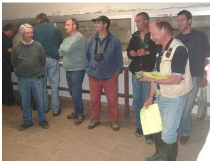
La remise des prix par notre Président, des scoubidous réalisés par un des pêcheurs.